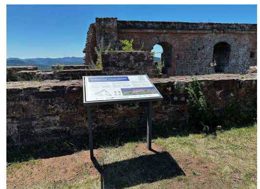
Signalétique trilingue Lindenbrunn (2025)

3 maquettes tactiles dans le Palatinat 4 vidéos promotionnelles de modélisations de châteaux en Alsace (en cours de finalisation) 1 vidéo promotionnelle de modélisation avec l'ensemble des châteaux modélisés (en cours de finalisation)