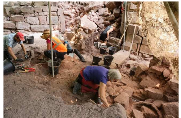
Ausgrabung Œdenbourg (2025)