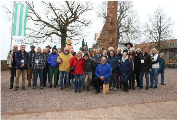
Rencontre réseau au Landeck (2024)