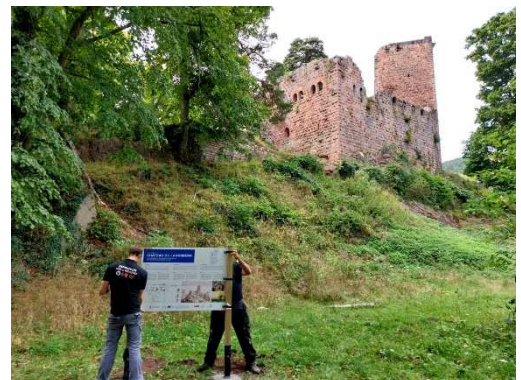
Signalétique trilingue Ottrott (2025)

21 panneaux dans le Palatinat 14 panneaux en Alsace (dont 7 en cours de finalisation)