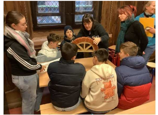
Rencontre scolaire au Haut-Kœnigsbourg (2023)

1 rencontre scolaire Lahr / Habsheim, 7 mars 2023 au Haut-Kœnigsbourg et 22 juin au Hohengeroldseck 38 élèves participants 2 châteaux visités