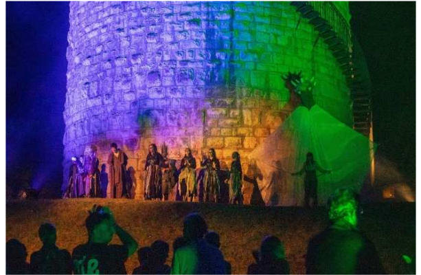
Festival Châteaux et légendes – Porrentruy