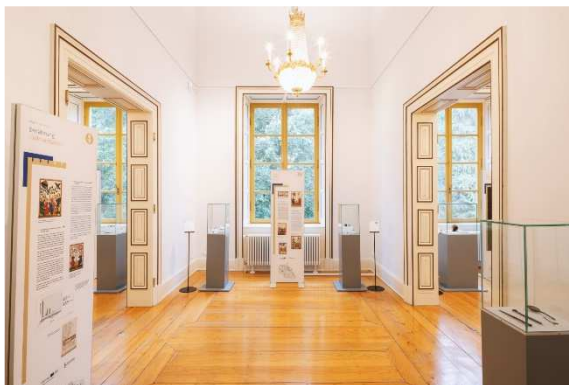
Exposition « Vestiges, trésors, légendes : châteaux rhénans » – Villa Ludwigshöhe