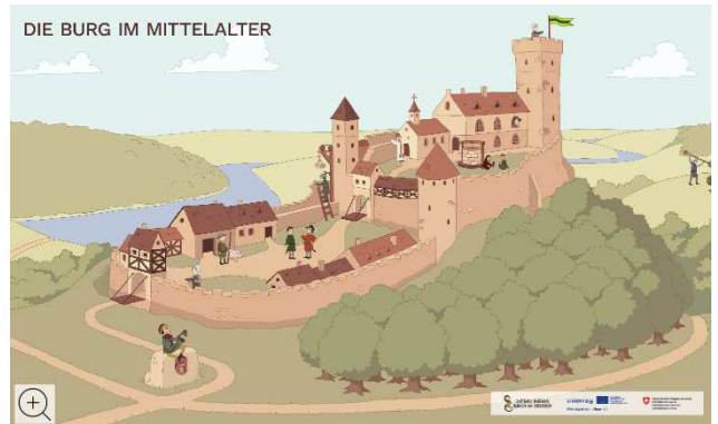
Vidéos de médiation jeune public

10 modélisations de châteaux en 3D 6 châteaux alsaciens (Wasenbourg, Oedenbourg, Ramstein, Hugstein, Pflixbourg, Frankenfels) 3 châteaux palatins (Trifels, Madenburg, Landeck)