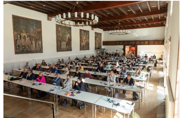
Colloque – Annweiler am Trifels (2023)